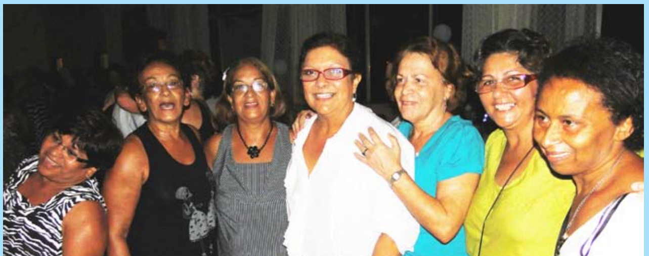
Graça prestigia Tarde Dançante